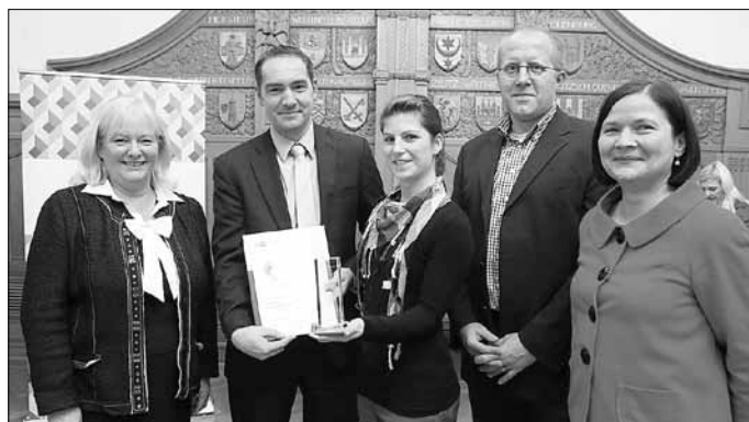
Die Klemme AG Lutherstadt Eisleben erhält das Gütesiegel „Top-Ausbildungsbetrieb 2012“