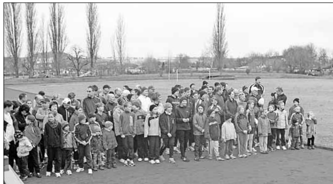
Massenstart ins „Neue Jahr“

Im vergangenen Jahr starteten über 100 Läufer aller Altersklassen und begannen den Sportplatz des SSV - Eisleben eine Stunde lang zu umrunden.