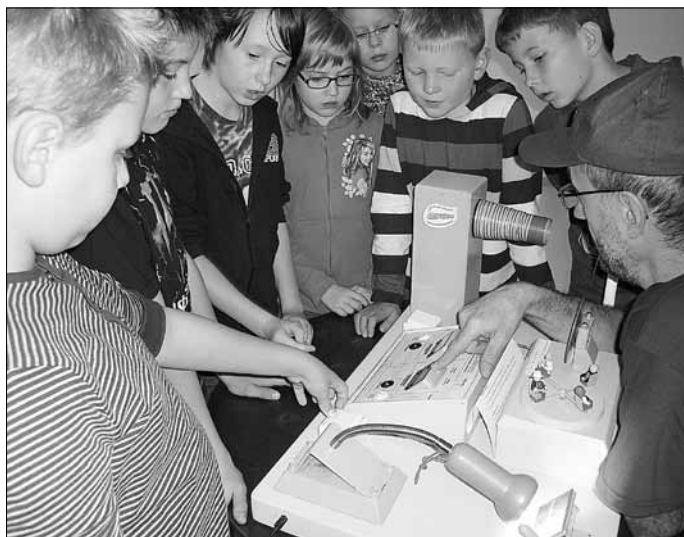
Gespannt hörten die Kinder dem Neugier-Express zu.

Der Neugier-Express machte seinem Namen alle Ehre. Lange weile kam an den beiden Tagen nicht auf. Mit großer Begeisterung und Spannung bestritten die Schüler alle Stationen und zum Abschluss gab es für jeden eine Teilnahmeurkunde. Für die Lehrer gab es Unterrichtsmaterial, welches zur Nachbereitung im Sachunterricht eingesetzt werden kann.