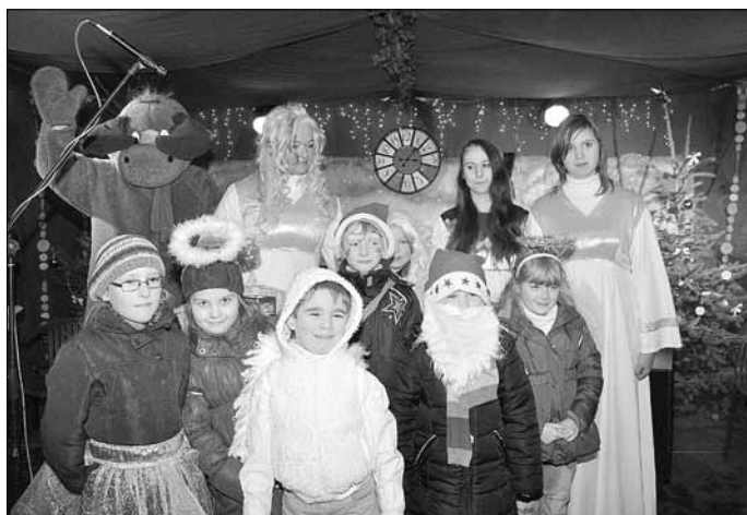
Kinder verkleideten sich und bekamen ein Geschenk

Am 7. Dezember 2013 folgte nun der Eisleber Weihnachtsmarkt, der wie jedes Jahr zahlreiche Menschen in die Innenstadt lockte.