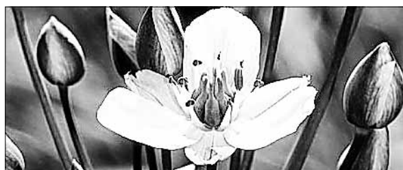
Die Schwanenblume „Blume des Jahres 2014“

Gesucht werden Anbieter mit markttypischen Produkten, welche dem Charakter der Veranstaltung entsprechen. Veranstaltungstage: 26. April und 10. Mai 2014 Bewerbungsschluss: 28. Februar 2014