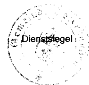
Rüdiger Folta Bürgermeister