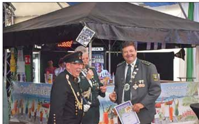
Der alte und der neue!

Sein Engagement wurde auch vom Landesschützenverband durch die Verleihung der Verdienstmedaille in Bronze sowie der Traditionsmedaille in Bronze gewürdigt.