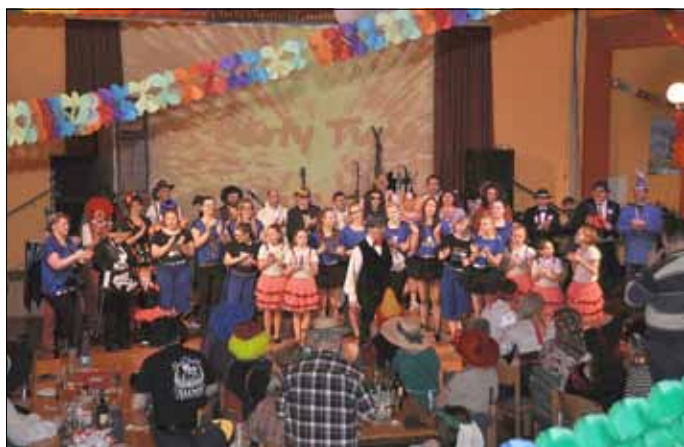
Festsitzung im Mansfelder Hof

An diesem Abend hatten sich die Karnevalisten des 1. Eisleber Carnevalsverein „De Lotterstädter“ im Saal des Mansfelder Hofes versammelt, um die schwere Bürde der Regentschaft abzugeben.