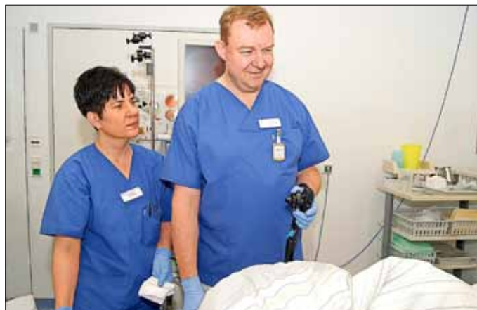
Während der Koloskopie

Die Darmspiegelung gilt bei vielen immer noch als besonders unangenehme Untersuchung. Viele Menschen scheuen sich nicht nur wegen des eigentlichen Untersuchungsvorgangs vor dem Eingriff - davon spürt der Patient in der Regel nichts, da er in einer Art Narkose ausgeführt wird - sondern auch wegen der Nachwirkungen, die man aus Berichten von Bekannten, aus Gesundheitsforen oder Lektüre kennt. Starke Blähungen, Unwohlsein und Völlegefühl nach der Untersuchung gehören in der HELIOS Klinik Lutherstadt Eisleben nun der Vergangenheit an.