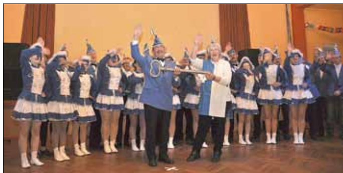
OB hat den Rathausschlüssel zurück

Die närrische Zeit im Rathaus ist seit dem 08.02.2016 vorbei. So wie die Narren am 11.11.2015, 11:11 Uhr vor dem Rathaus der Lutherstadt Eisleben mit der symbolischen Schlüsselübernahme die Regentschaft über die Stadt übernommen hatten, so übernahm die Oberbürgermeisterin am Rosenmontag um 20:20 Uhr wieder den Rathausschlüssel.